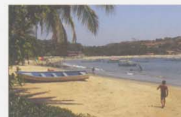
Jak může svět vypadat při korekci astigmatismu.

Většinou ano. Kontaktní čočky ACUVUE® OASYS™ for ASTIGMATISM jsou speciálně určeny pro korekci astigmatismu, takže poskytují ostřejší vidění než běžné (sférické) kontaktní čočky.