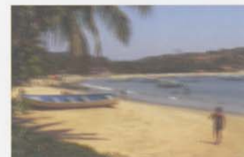
Pohled na svět při astigmatismu.

Lidé s astigmatismem nemusí vidět zaostřeně současně v horizontále a ve vertikále. Proto mohou mít při pohledu do dálky i do blízka neostrý nebo deformovaný obraz.