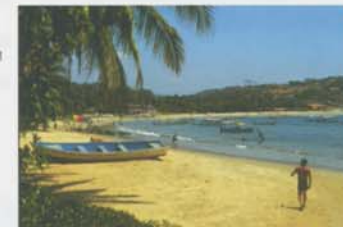
Jak může svět vypadat při korekci astigmatismu.

Většinou ano. Kontaktní čočky ACUVUE® ADVANCE™ for ASTIGMATISM jsou speciálně určeny pro korekci astigmatismu, takže poskytují ostřejší vidění než běžné (sférické) kontaktní čočky.