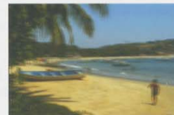
Pohled na svět s astigmatismem.

Lidé s astigmatismem nemusí vidět zaostřeně současně v horizontále a ve vertikále. Proto mohou mít při pohledu do dálky i do blízka neostrý nebo deformovaný obraz.